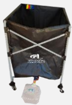
Bac de lavage