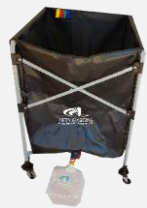
Bac de lavage